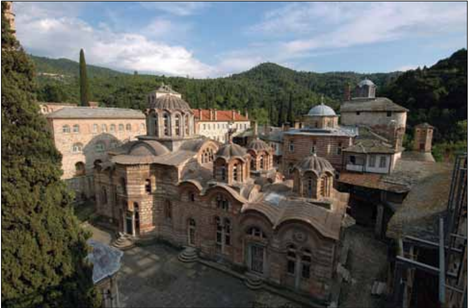
Црква Свете Богородице (краља Милутинова)

Краљ Милутин је подигао данашњу цркву Свете Богородице у Хиландару 1303. године, на месту некадашње старе и мале Симеонове и Савине цркве, од које је остала једино икона и нешто фрагмената пластике, који су делимично уграђени у нову цркву. Милутинова црква постала је узор за градњу храмова у моравској Србији, крајем XIV и током прве половине XV века. Задужбина краља Милутина је и манастирска трпезарија, са многим ћелијама или палатама, сличним средњовековним владарским дворovima. Милутин је цео манастир оградио високим и чврстим зидом, на коме су касније изграђене бројне зграде.