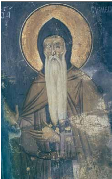
Свети Сѣмеон Немања, главна манастѣрска црква, јуѡзайадни шравеј наоса

Стручњаци Републичког завода за заштиту споменика културе проценили су да је, у грађевинском смислу, изгорело више од 42 одсто површине објеката манастира, док је корисне површине у тим објектима изгорело и више – преко 54 одсто.