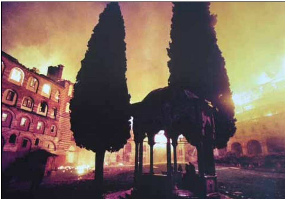
Пожар у Хиландару

Целокупна реконструкција и обнова раде се уз стручни надзор, да би се очувало архитектонско наслеђе и амбијентална целина манастира Хиландара.