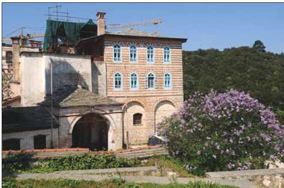
Обнова Хиландара после пожара