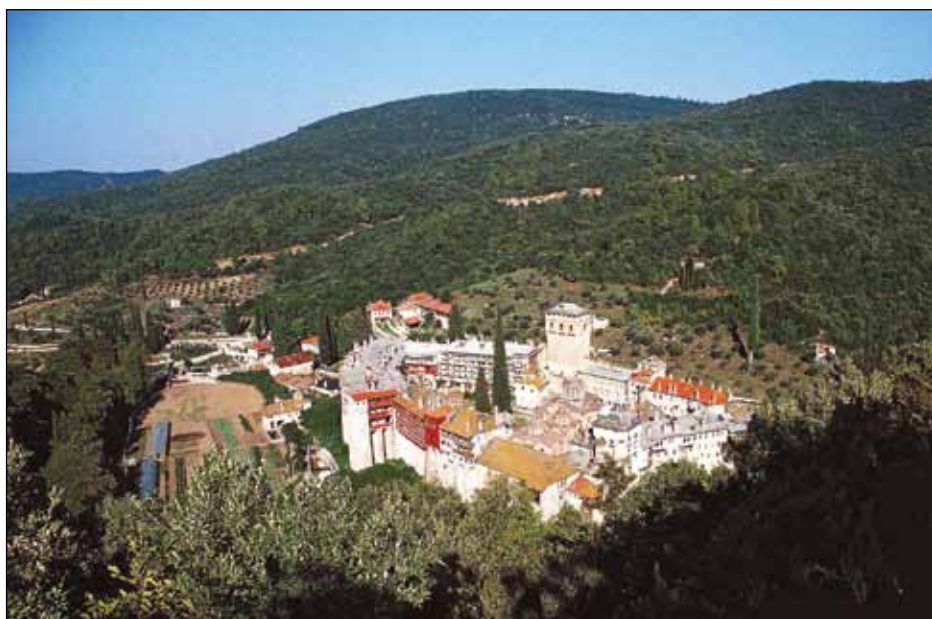
Хиландар (изглед њре 3. марта 2004)

М анастир Хиландар је први у низу великих задужбина, који представља сам стожер наше духовне и културне баштине. Он је најпознатија светиња Српске православне цркве. Налази се у северној Грчкој, на Светијој јори , на трећем краку полуострва Халкидики. Светија јора , или Перивој њресветије Бојородице , позната је по двадесет православних манастира. Већина њих се налази на самој морској обали, док је Хиландар око два километра удаљен од мора. У средини полуострва налази се Кареја, управни центар Светије јоре , у коме су представништва манастира и грчке државе.