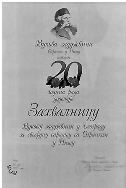
Захвалница Огранка Вуковој задужбини