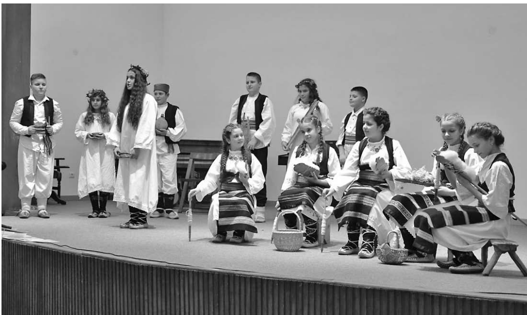
Учесници програма „Чувари дела Вука Караџића“